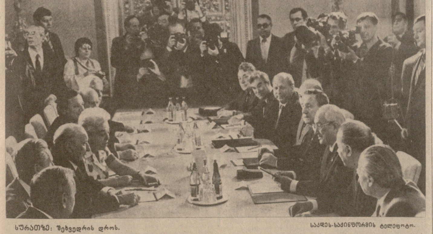
სურათში: შეხვედრის დროს.