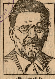
ამხ. კალინ ნი.

დღეს სრულდება 50 წელი დღიდან ამხ. კალინინის დაბადებისა.