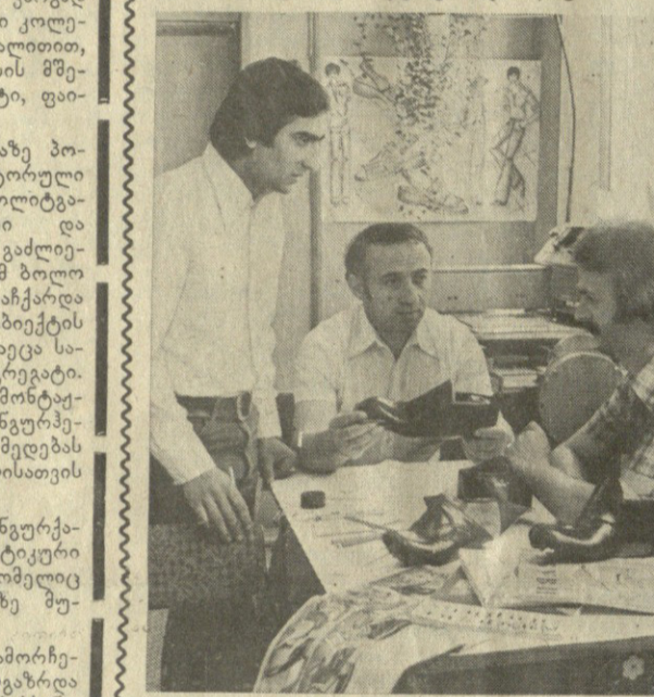
ახლა კომბინატი უზენაეს ხარისხის სახელმწიფო ნივთიერებებს...