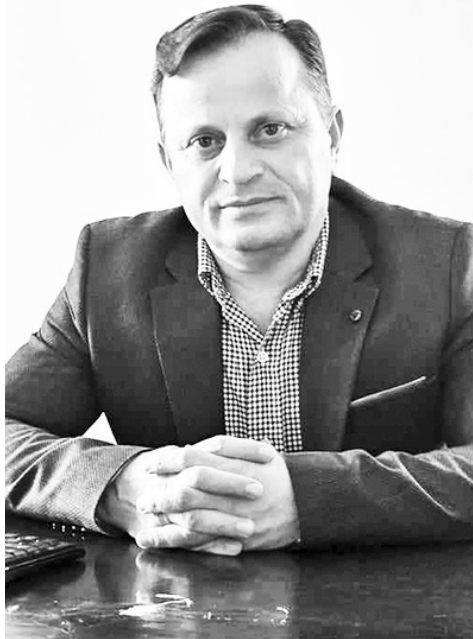
სწავლების ხარისხის ამაღლებას.