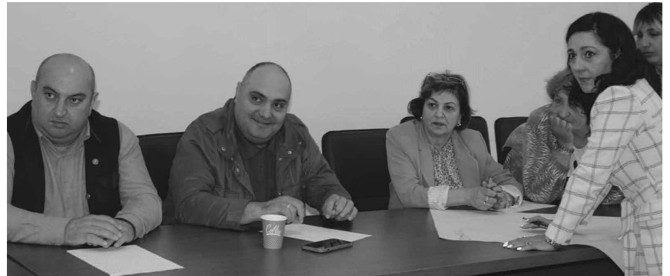
ადგილობრივი ეკონომიკური თუ სოციალური განვითარება უწყვეტი და კომპლექსური პროცესია, რომელიც უკავშირდება საზოგადოებრივი ცხოვრების ყველა სფეროს და უშუალო გავლენას ახდენს მასზე. ასეთი კომპლექსური ხასიათის გამო, აღნიშნული სტრატეგია უნდა შეესაბამე-