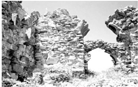
„არს მთის კალთას, სკანდას, სასახლე მეფეთა და ციხე დიდი, დიდშენი“ მასშობი პაბრატიონი