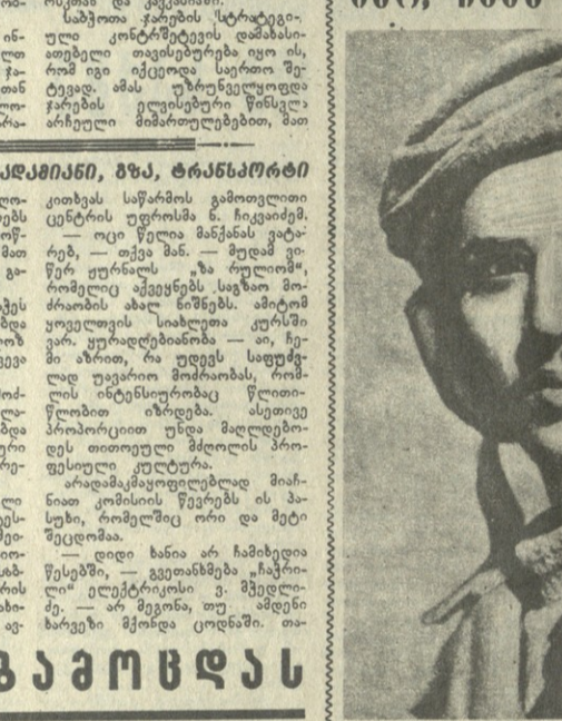
დაიწყო რგოლის დაწყება