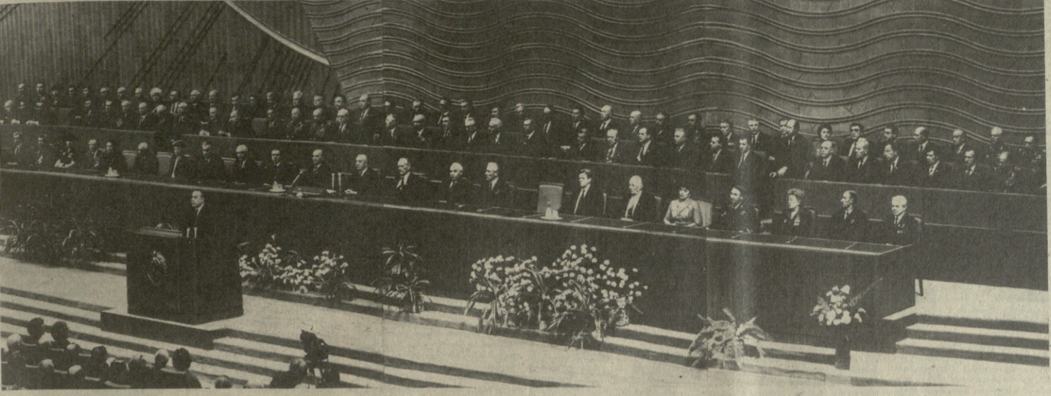
მოსკოვი, კრების ყრილობა სახალდ. ვ. ი. ლენინის დაბადების 115 წლისთავსადმი მიძღვნილი საზეიმო სტომა.

სამშაბათი, 23 აპრილი, 1985 წელი. ღარი 3 კაპ.