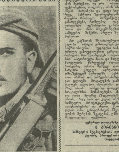
დაიწყო რგოლის დაწყება