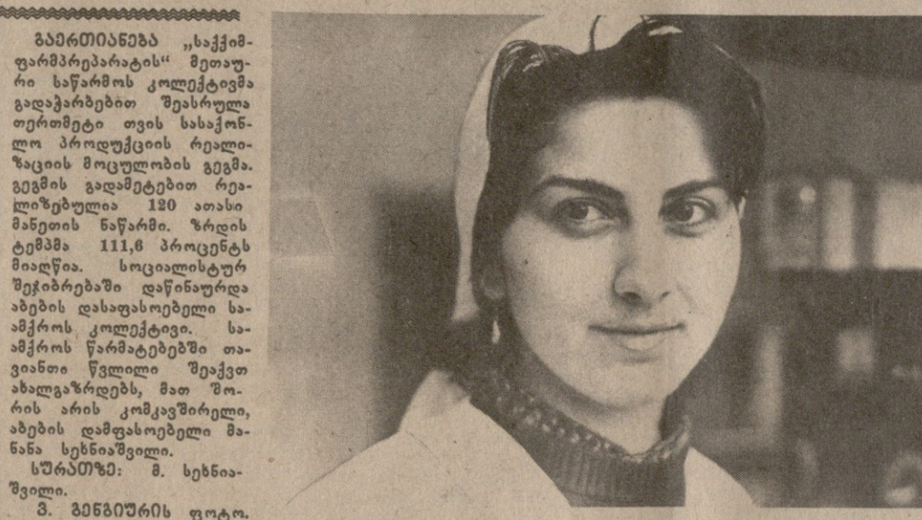
ბატონიანა „საქმის“ ფარმაცეუტის მეთაური ნაფარის კოლმეტეა...