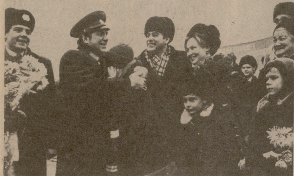
სურათი: შეხვედრის დროს.