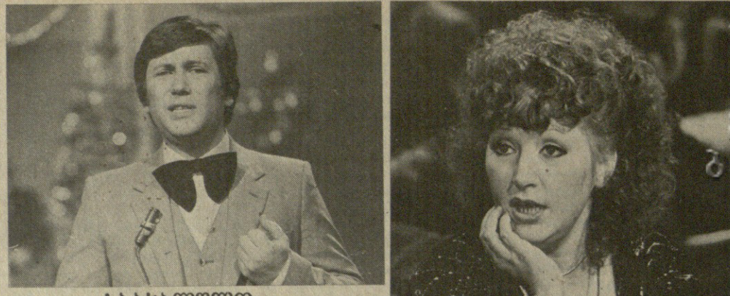
სახალწლო „ცისფერი პერანი“ მისამართი. მთლიანობა ტემპერატურული...