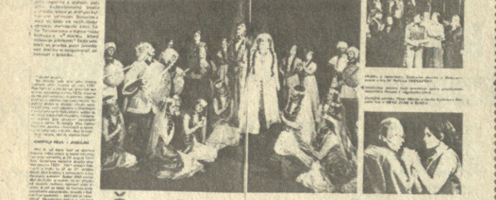
Styrisko opón ročne