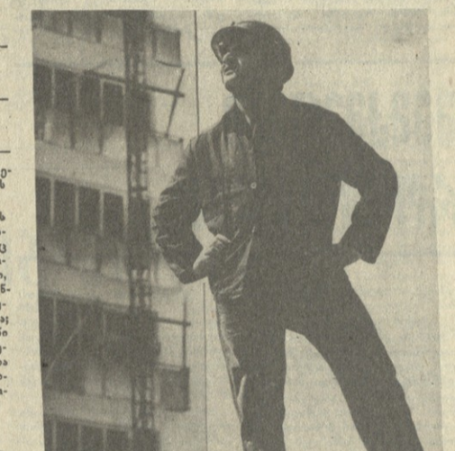
საქართველოს მშენებლის დღე