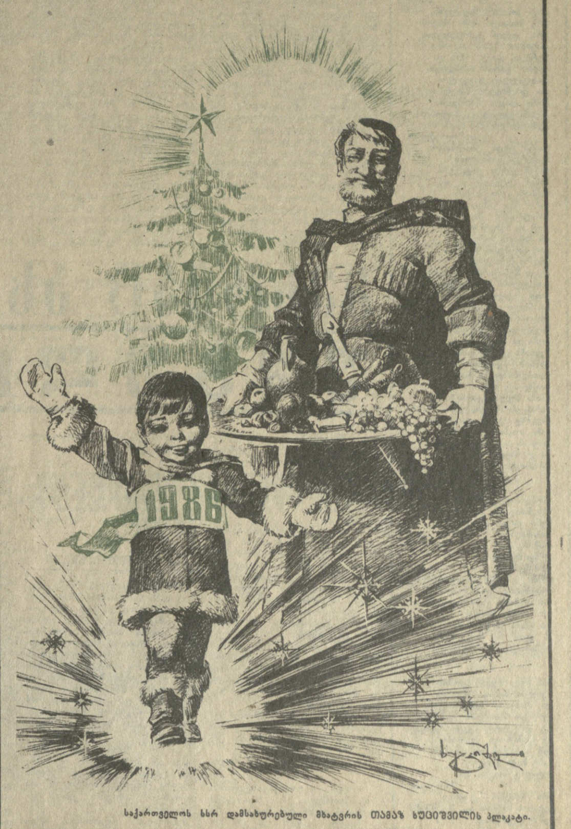
საქართველოს სსრ დამახორებულმა მხარეის თანამშრომელის პლაკატი.

ჩვენი ვულოცავთ მეგობარ საბჭოთა ხალხებს, რომლებიც დამოუკიდებელი ერთიანი საბჭოთა კავშირის არსს და მისი რეჟივს სამხედრო ავანტიურებში უღრმესად უბასუსხს მტეგებლებს.