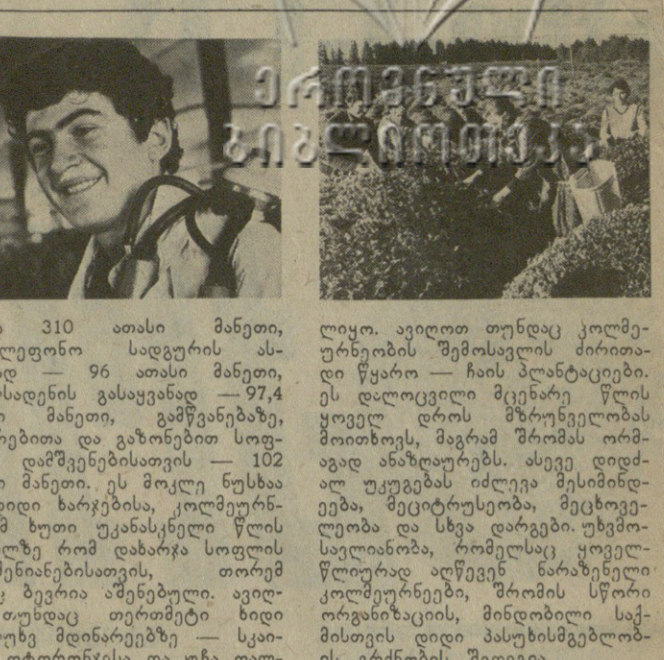
ხათილამ წლის წინათ კოლმეურნობის ახალმა თევზად...