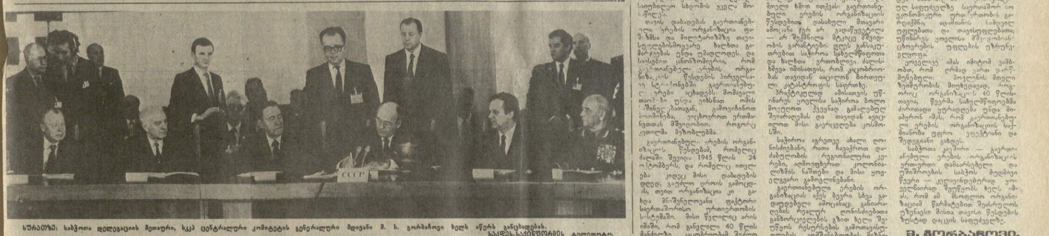
საბჭოთა კავშირის მთავარი, სკკ ცენტრალური კომიტეტის განცხადება