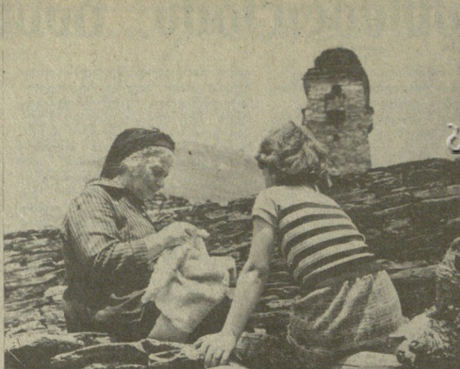
თუბათი... გაზარდული ბურჟუაზიი წევრებით იცვლება...