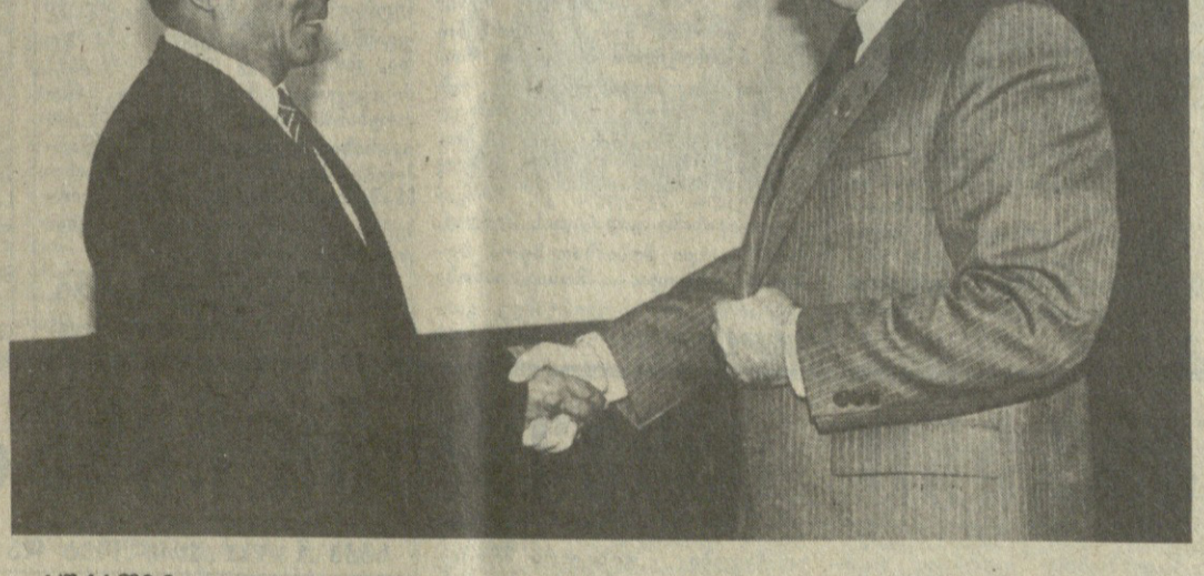
სურათზე: საუბრის დროს.