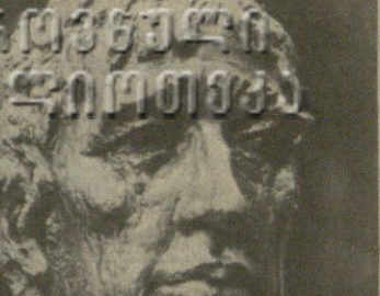
საბჭოთა კავშირის მთავარი პარტიის მდივანი

მითინგის განხორციელების საქართველოს ოფიციალური წარმომადგენლებსა და სამხედრო სპეციალისტებს შორის, რომელსაც გასაქმებდნენ როგორც სსრკ-ში, ისე მთელს მსოფლიოში.