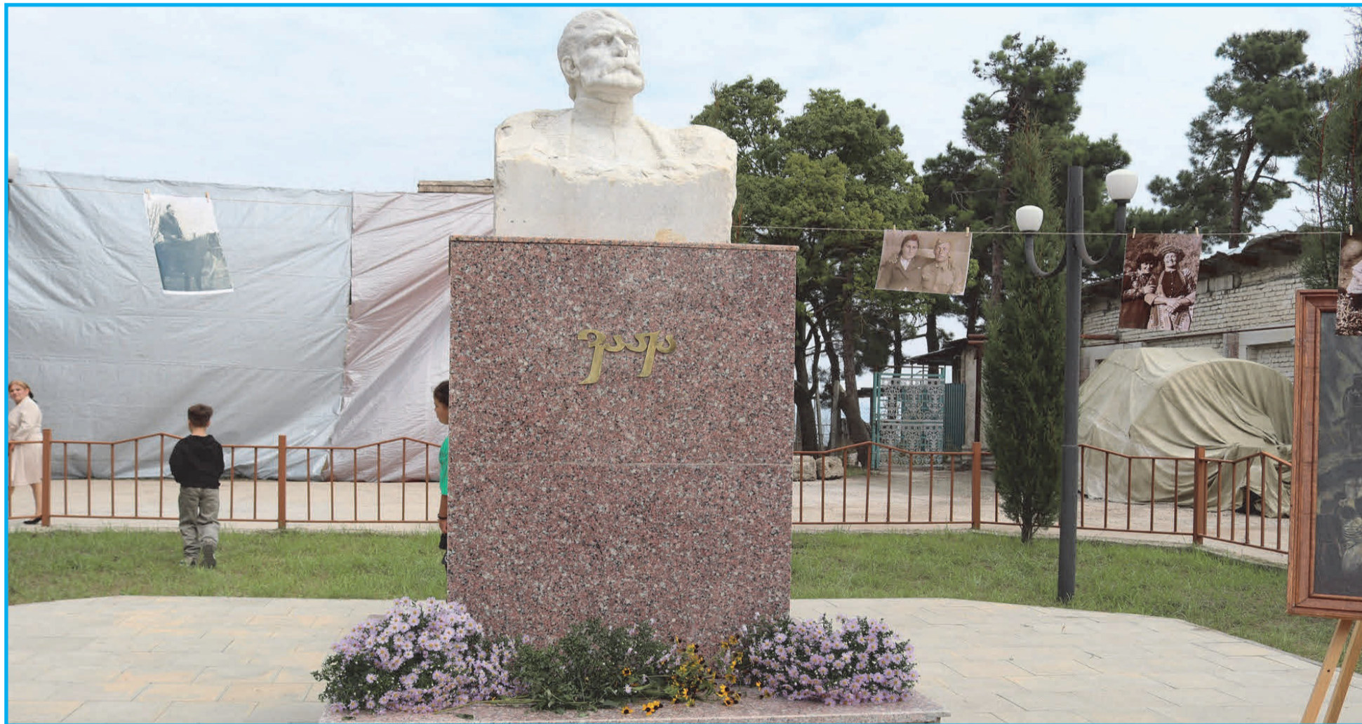
ქვემო ქედი, ორიოდე წელში, დაარსებიდან 120 წლისთავს იხეივებს. შირაკში მთიელების, კერძოდ კი ფშავლების ჩამოსახლების იდვის სულისჩამდგმელი ვაჟა-ფშაველა იყო.