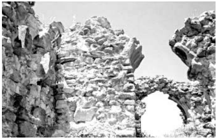
„არს მთის კალთას, სკანდას, სასახლე მევეთა და ციხე დიდი, დიდშენი“ პანსუპტი ბაბრატომონი