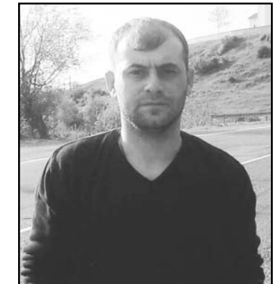
მისი ხელიდან არ გამოდიოდა, ვის არ დაჭირებია და ვისთვის არ გაუშართავს ხელი. ელსაქმეში ხომ ზადალი არ ჰყავს, მერიის კეთილმოწყობისა და დასუფთავების სამსახურში სწორედ ამ ნიშნითაა დასაქმებული და სხვა უამრავ საქმესაც ასრულებს საჭიროების შემთხვევაში. ჩვენს გაზუთშიც არაერთხელ ყოფილა წარმოჩენილი.