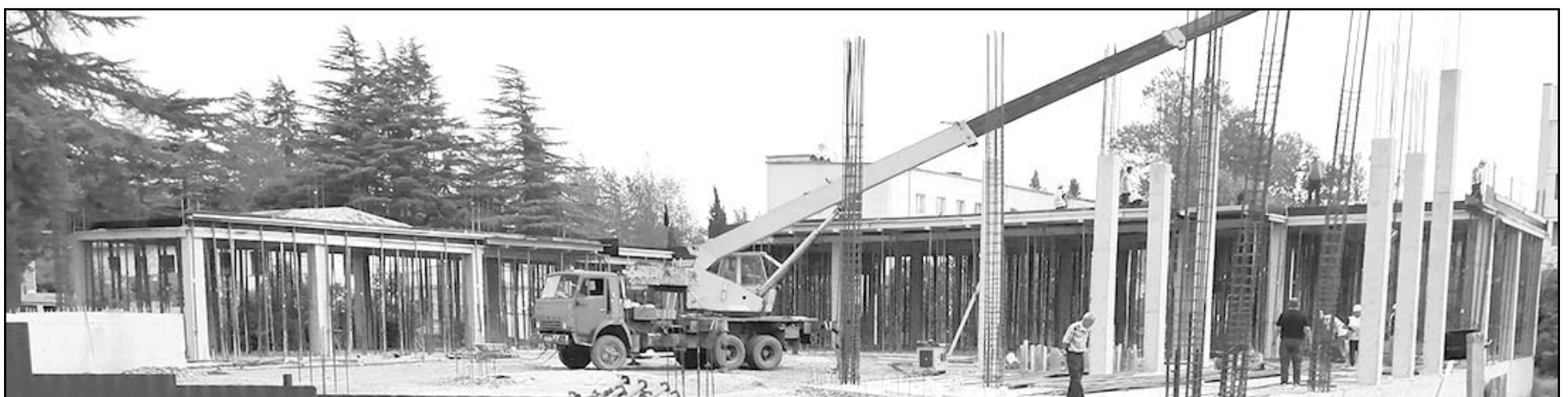
იუსტიციის სახლის (რუსთაველის ქუჩა, 116) მშენებლობა მიმდინარე წელსვე დასრულდება. სამუშაოთა მწარმოებელია შპს „ენი ჯგუფი“.