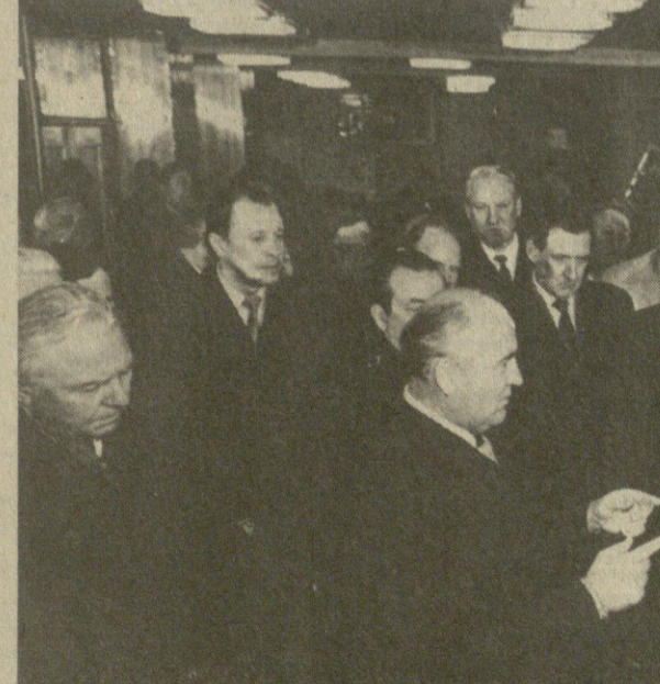
გაფორმების დოკუმენტების დროს