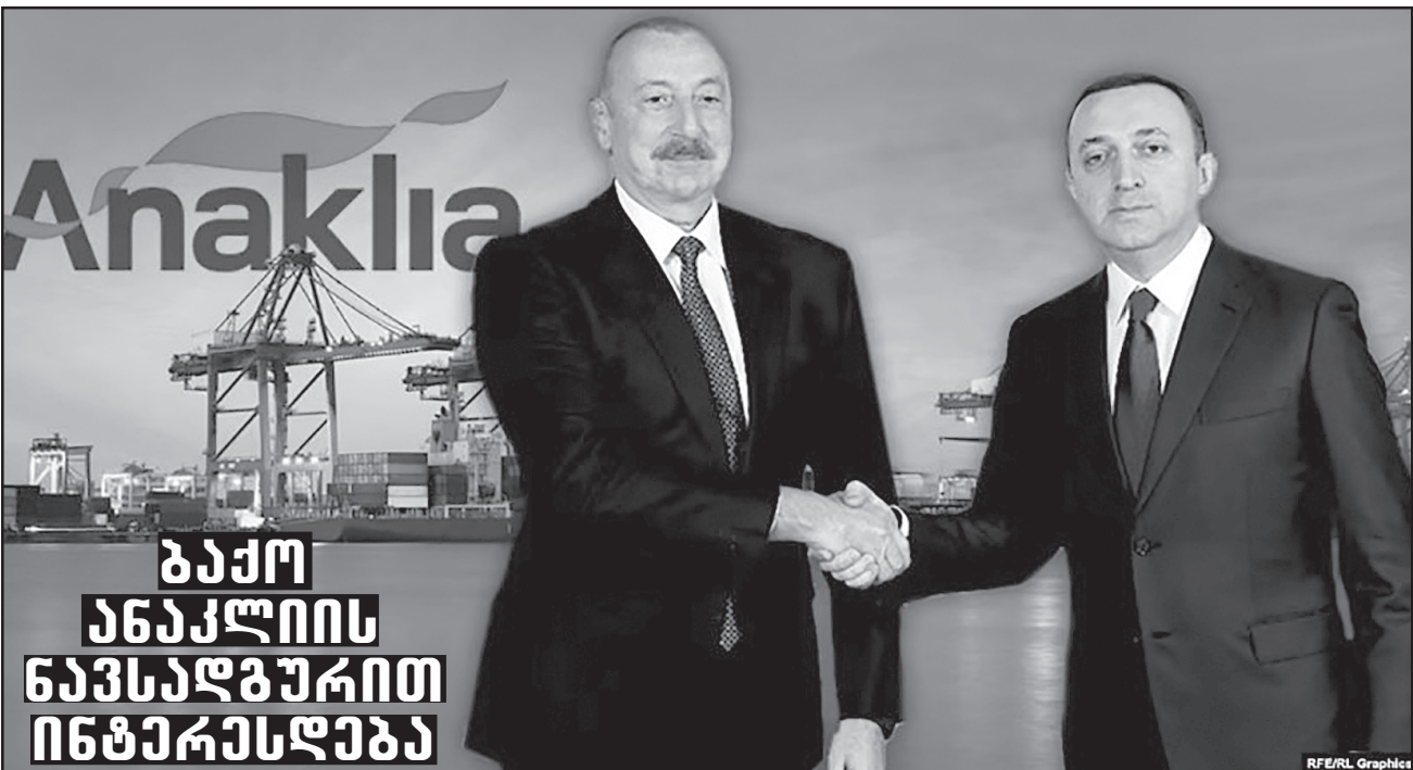
გაქო ანაკლიის ნავსადგურით ინტეგრაცია