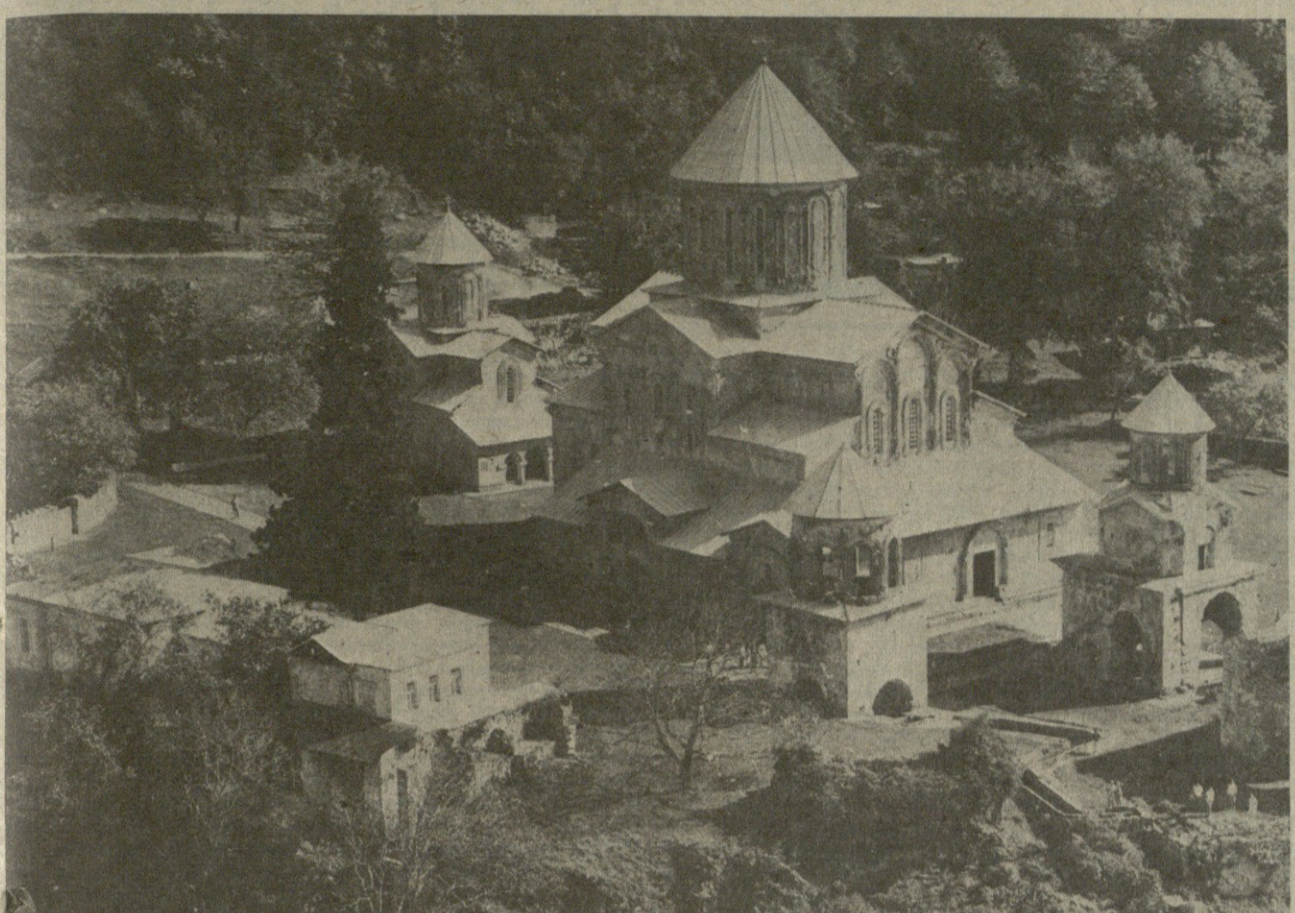
მდის მადლიერი შთაბეჭდილება, სრულიად საქართველო შეიქმნა საზოგადოებრივ-კოლმეურნეო საქმიანობის სარბიელად დაფუძნების გამოცემის 900 წლისთავს.

სახალხო მუშაობა: ბანკოთარების პირაპირადი 2005 წლისთვის