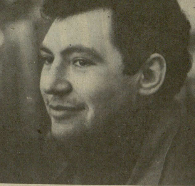
თბილისის პარტიის სახელმძღვანელო კომიტეტის წევრი...