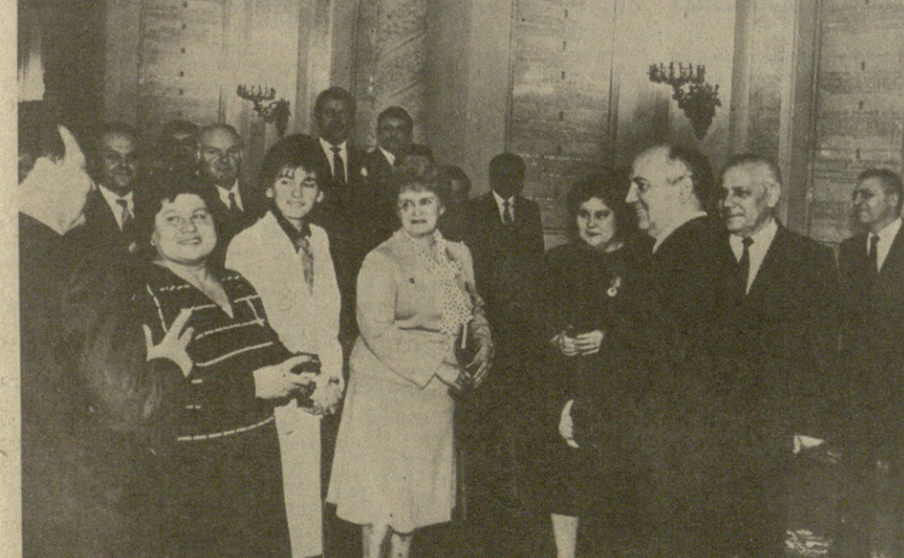
24 მარტს კრებულმა სსრ ცენტრალური კომიტეტის მდიანობის უმაღლესი საბჭოს პრეზიდიუმის თავმჯდომარე მ. ა. გორბაჩოვის ხელმძღვანელობით და მთელი პარლამენტის ერთი მესამედი წარმოადგინა. მათ შორის ბევრი ახალი სახეებიც შედიოდა.

კომუნისტი უმაღლესი სახელმწიფო ორგანოში ახალმა დეპუტატმა არჩევნები დასრულდა უახლოესი უმაღლესი დეპუტატების საზოგადოებრივი ორგანიზაციებისაგან, მთელი პარლამენტის ერთი მესამედი წარმოადგინა. მათ შორის ბევრი ახალი სახეებიც შედიოდა. კომუნისტი უმაღლესი სახელმწიფო ორგანოში ახალმა დეპუტატმა არჩევნები დასრულდა უახლოესი უმაღლესი დეპუტატების საზოგადოებრივი ორგანიზაციებისაგან, მთელი პარლამენტის ერთი მესამედი წარმოადგინა. მათ შორის ბევრი ახალი სახეებიც შედიოდა.