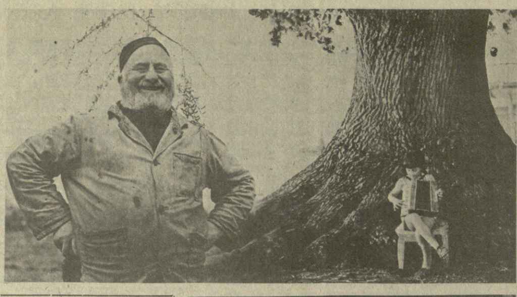
სულტარის ახალი ახვანი