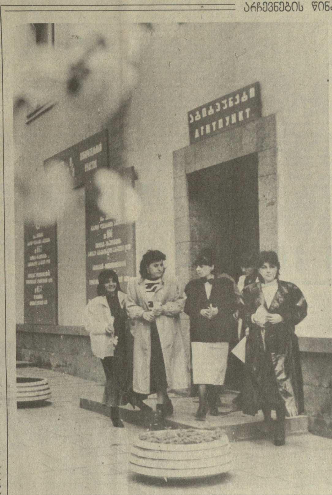
ანს გამოყურება თბილისის ორწინიანი საარჩევნო ოლქის ერთ-ერთი საარჩევნო უბანი. აქ უკვე მზად არიან ამომრჩევლები მისაღებად.

მედიის უმაღლესი სახელმწიფო ორგანოში ახალმა დეპუტატმა არჩევნები დასრულდა უახლოესი უმაღლესი დეპუტატების საზოგადოებრივი ორგანიზაციებისაგან, მთელი პარლამენტის ერთი მესამედი წარმოადგინა. მათ შორის ბევრი ახალი სახეებიც შედიოდა. მთელი პარლამენტის ერთი მესამედი წარმოადგინა. მათ შორის ბევრი ახალი სახეებიც შედიოდა. მთელი პარლამენტის ერთი მესამედი წარმოადგინა. მათ შორის ბევრი ახალი სახეებიც შედიოდა. მთელი პარლამენტის ერთი მესამედი წარმოადგინა. მათ შორის ბევრი ახალი სახეებიც შედიოდა. მთელი პარლამენტის ერთი მესამედი წარმოადგინა. მათ შორის ბევრი ახალი სახეებიც შედიოდა.