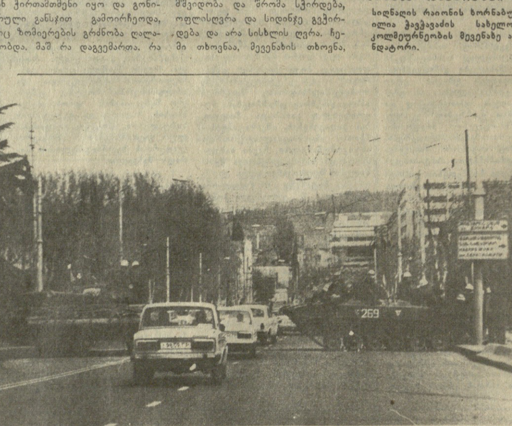
თბილისი, 10 აპრილი...