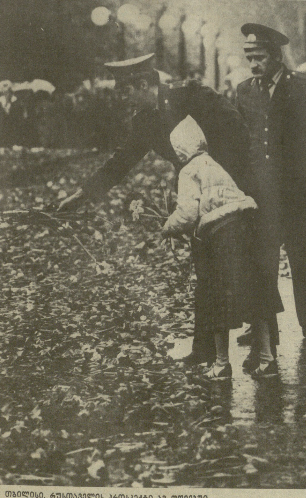
თბილისი, რუსთაველის პროსპექტი ახ დღეებში...