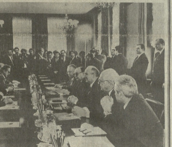
საუბრის დროს. მ. ს. გორბაჩოვი (მარჯვნივ) და პ. ნატსვილი (მარჯვნივ).

მ. ს. გორბაჩოვი უხვდა პ. ნატს. საქართველოს კომუნისტური პარტიის ცენტრალური კომიტეტის მდიანობის დასრულება 1988 წლის 16 აპრილს 11 საათზე საქართველოს სსრ უმაღლესი საბჭოს სხდომათა დარბაზში.