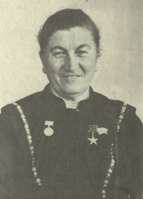
სსრ კავშირის უმაღლესი საბჭოს პრეზიდიუმის ბრძანებულებით...