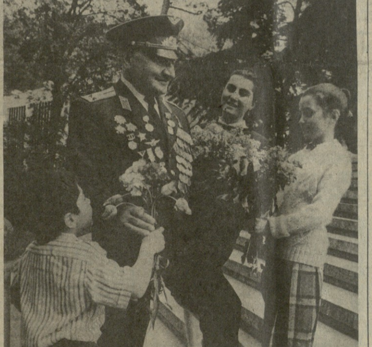
საბუნაშრომის ვეტერანი, საბჭოთა კავშირის გმირი, ვადამგარი ვარდის პოდპოლკოვნიკი, ყოფილი მდინარე ვარდის თაყვანის თვის შვილი შეიღებინა.