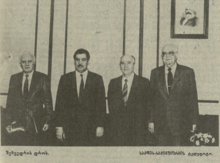
შეხვედრის დროს. მ. ს. გორბაჩოვი (მეორე მხრიდან) და ნაიპოვი (მესამე მხრიდან)

მ. ს. გორბაჩოვი და ნაიპოვი დაინახნენ ერთ-ერთი წინადაცხადებით, რომელიც მონაწილეობდა შეხვედრაში. მ. ს. გორბაჩოვი და ნაიპოვი დაინახნენ ერთ-ერთი წინადაცხადებით, რომელიც მონაწილეობდა შეხვედრაში.