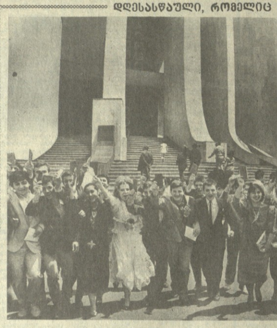
დადსასჯადი, რომელიც არ მითვრდება