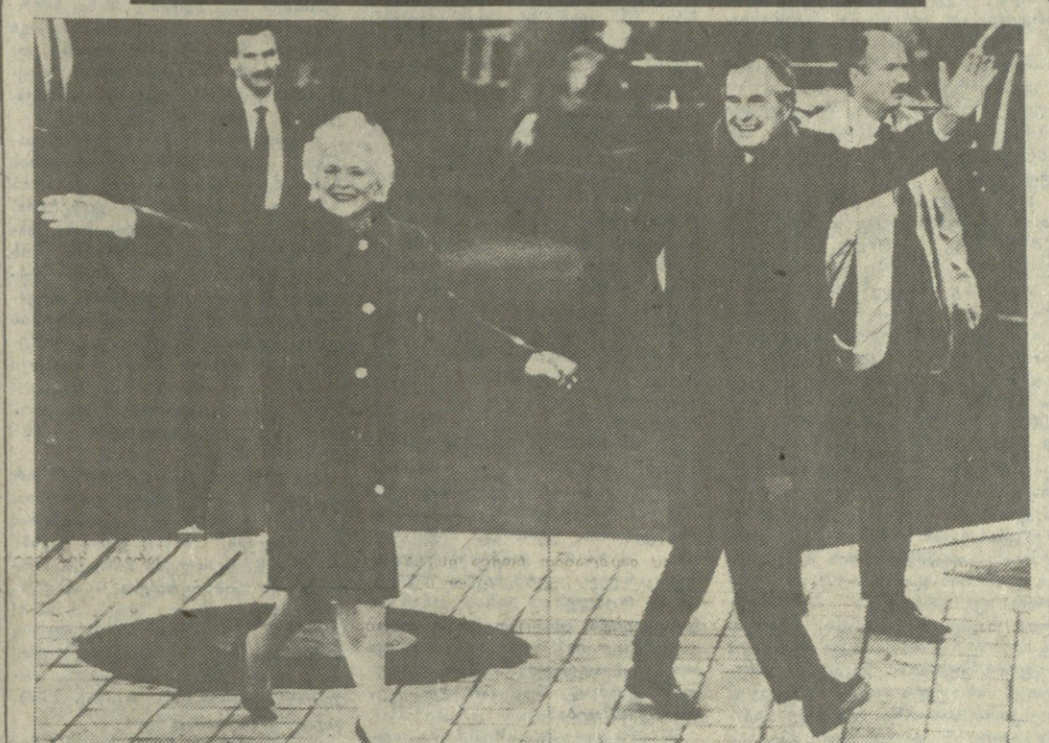
ფინეთის პრეზიდენტი იააკო ვირჰენი და მისი ოჯახი.

დედობრადი — ტელევიზიური გადაცემა, რომელიც მოიცავს დრამატულ ნაშრომებს და სხვა ტიპის პროგრამებს.