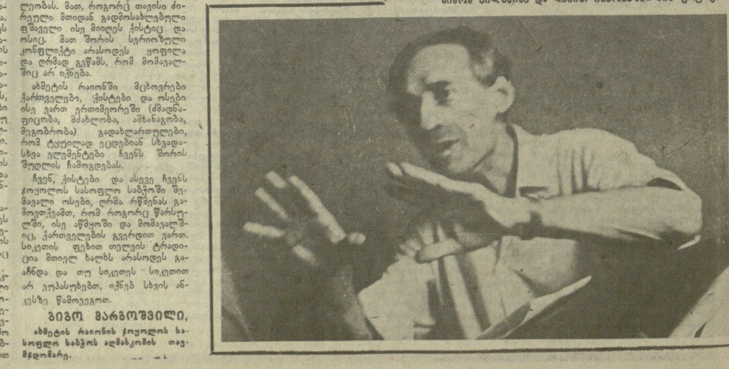
დილონი — ვადასტურებთ... მთავარი ინფორმაცია საბჭოთა საზოგადოებაში პარტიის ადგილი გარდაიქმნა.