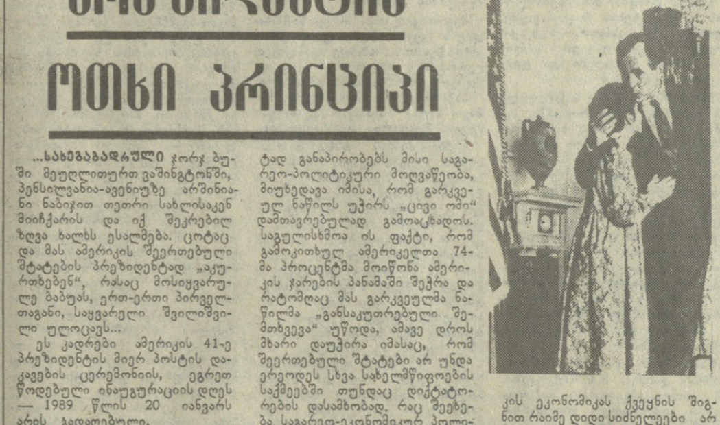
ფინეთის პრეზიდენტი იააკო ვირჰენი.

ფინეთის პრეზიდენტი იააკო ვირჰენი ამბობს, რომ ფინეთში უმეტესად ფინურად ლაპარაკობენ, მაგრამ უმცირესობაში სხვა ენებიც გამოიყენება.