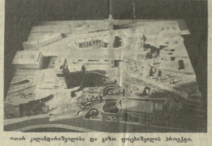
ოთარ კალანდარიშვილისა და გიორგი ფოცხველიძის პროექტი