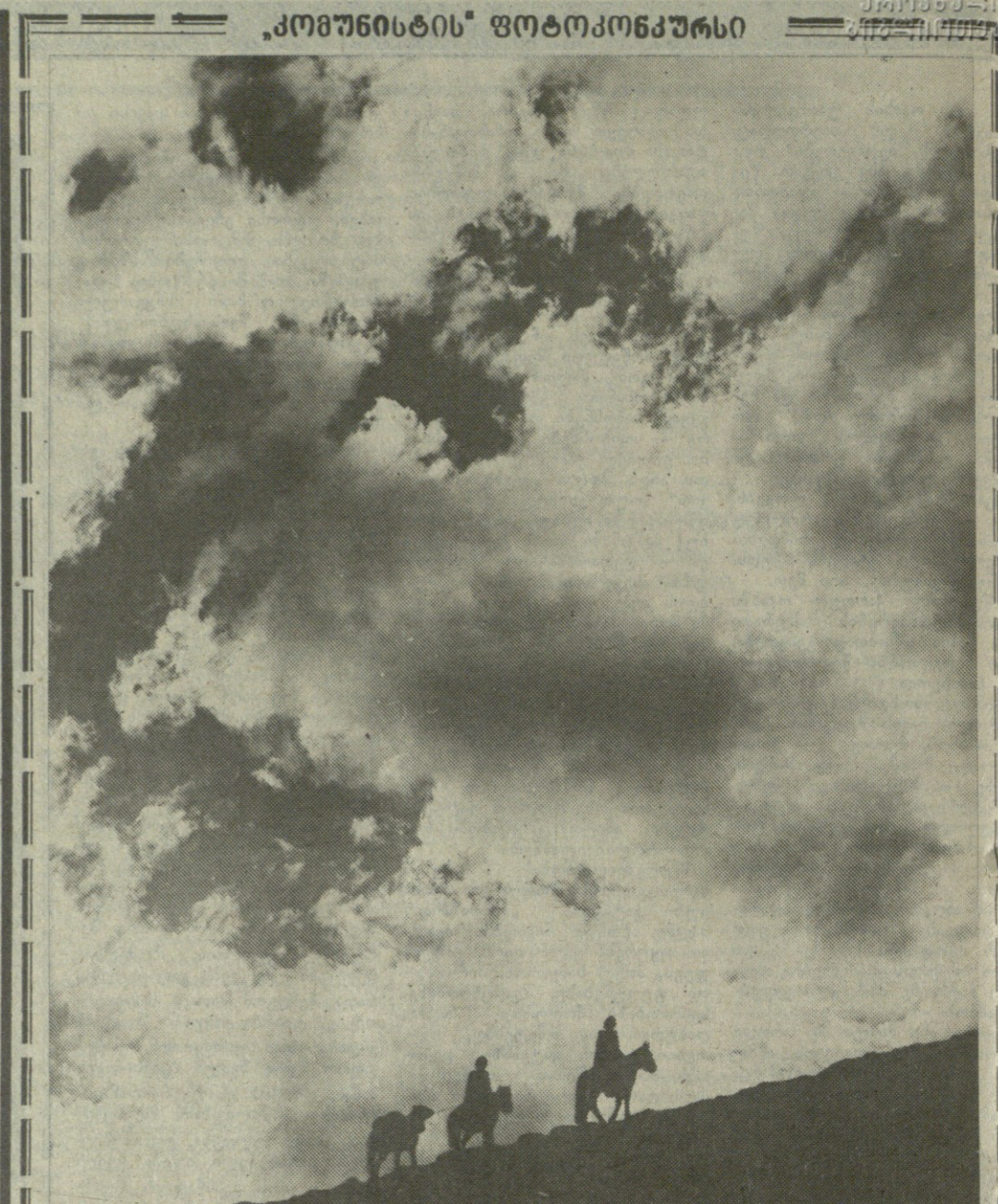
მეზობლის მთაში.