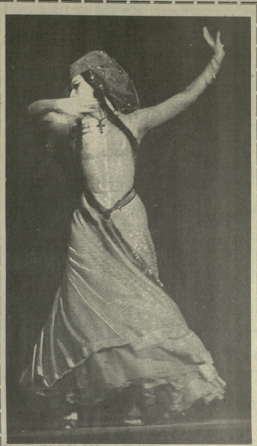
შემოვლან რიკვიტი კვალადს ვარდნი... იმუარდ გიმილავილის ფოტო.