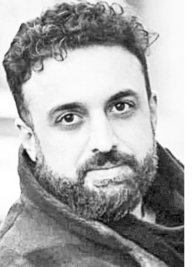
აც თავს ყველაზე კომფორტულად გრძობს, შექმნის ღრუბული, მიიღოს ზღვა ემოცია და სხვებსაც გა-