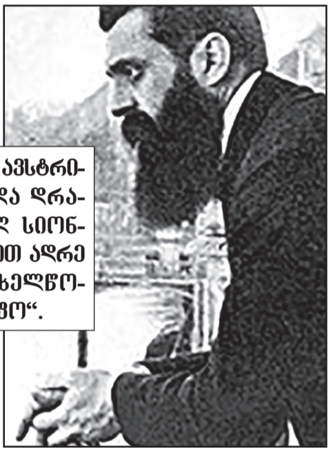
მაგრამ გავიდა დრო და ინგლისის პოლიტიკა პალესტინაში შეიცვალა. მათ ფსონი არაბებზე დადეს.

ოფიციალური ცნობებით, 1844 წელს იერუსალიმში ცხოვრობდა 7 000 ებრაელი, 3 000 ქრისტიანი და 5 000 მუსულმანი. XIX საუკუნის დასასრულს იერუსალიმში იყო 28 000 ებრაელი, 17 000 მუსულმანი და ქრისტიანი. შემდეგ საუკუნის დასაწყისისთვის იერუსალიმში ცხოვრობდა 100 000 ებრაელი, 45 000 მუსულმანი და 25 000 ქრისტიანი.