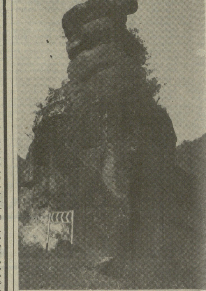
სანისის სვეტი.