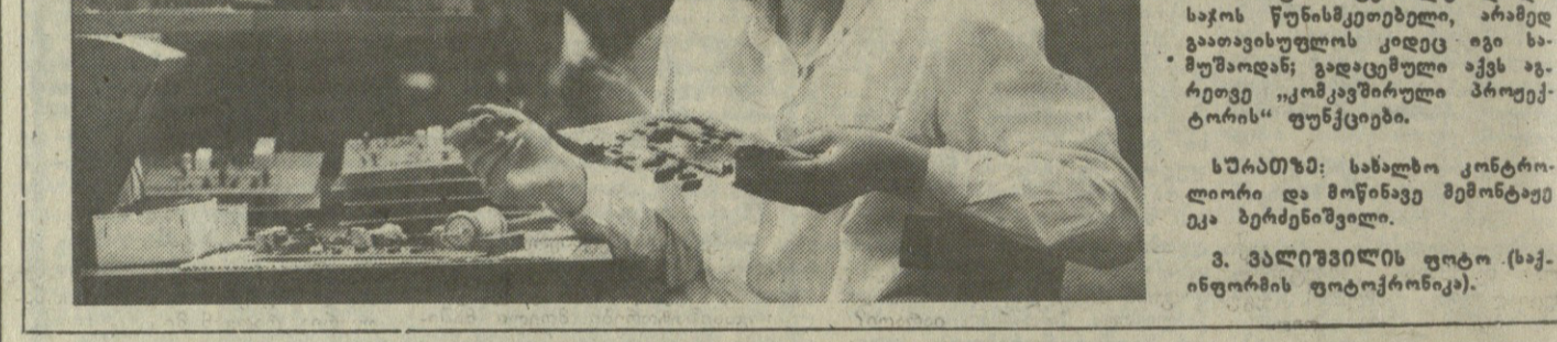
სახალხო მუშაკების სუბვენიციები

სახალხო მუშაკების სუბვენიციები. სახალხო მუშაკების სუბვენიციები. სახალხო მუშაკების სუბვენიციები.