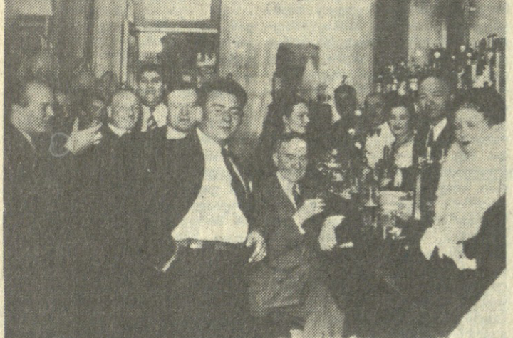
„შაბათის“ ა. ენუქიძის ბინაში უმაღლესი სტამბის შედეგად...