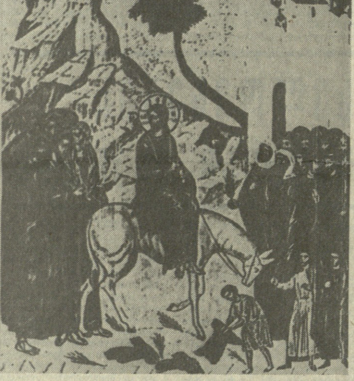
სურს მესვლა იერუსალიმში.