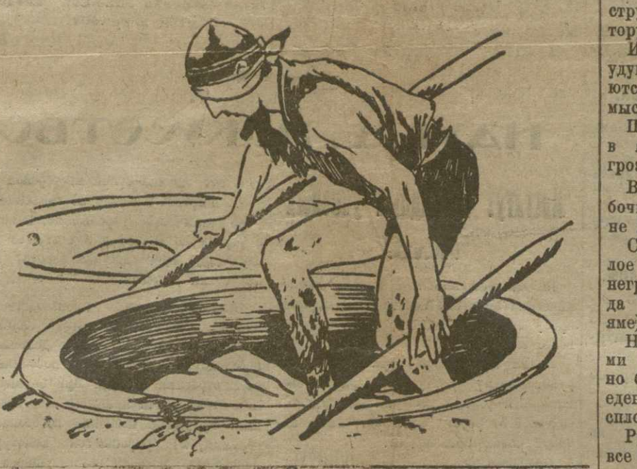
Работа эта протекает методично, но спеша [по]... 3—4 часа подряд, без отдыха.