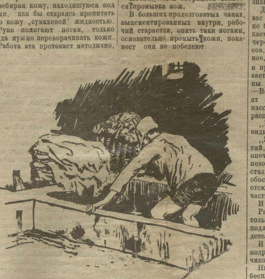
Работа эта протекает методично, но спеша, но... часа три четыре подряд без отдыха.