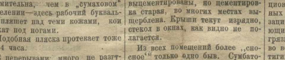
Работа эта протекает методично, но спеша, но... часа три четыре подряд без отдыха.