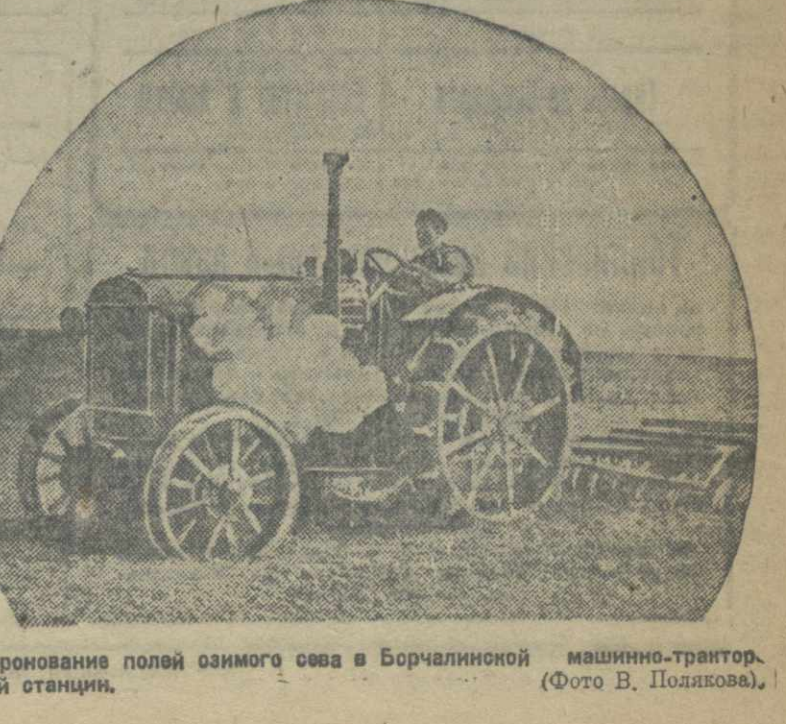
Боронение полей озимого сева в Борчалинской машинно-тракторной станции.

До столетней годовщины со дня смерти Пушкина, до 10 февраля 1937 г., осталось немного времени. Все литературные, общественные, партийные организации должны приложить усилия к тому, чтобы чествование Пушкина было действительно всенародным праздником советской культуры.