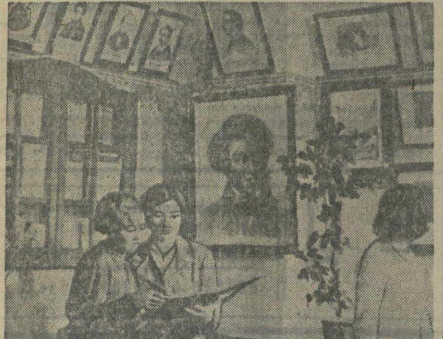
Литературным отделением Тамбовского педагогического института открыта большая выставка и 100-летию со дня смерти А. С. Пушкина. На снимке: группа студентов института занимается с пушкинской выставкой.