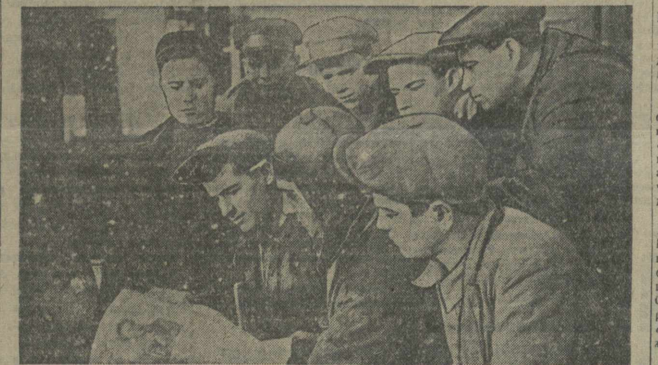
«Наш гудок» — заводская газета паровозно-вагоноремонтного завода им. Сталина — очередной номер посвящен творчеству А. С. Пушкина.

ВАЗУ, 5 (ТА). Впервые в Советском Союзе Азербайджан начался осуществление труднейшей задачи — перезвучивание фильма на азербайджанский язык.