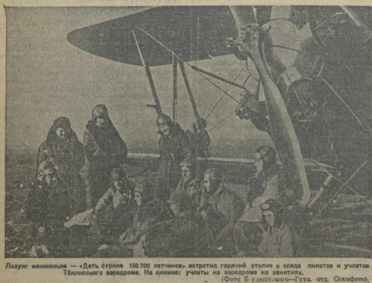
Лозунг мексиканцев — «Дать стране 150 000 летчиков» встрял горячий отклик в среде пилотов и учлетов Тбилисского аэродрома. На снимке: учлеты на аэродроме на занятиях.