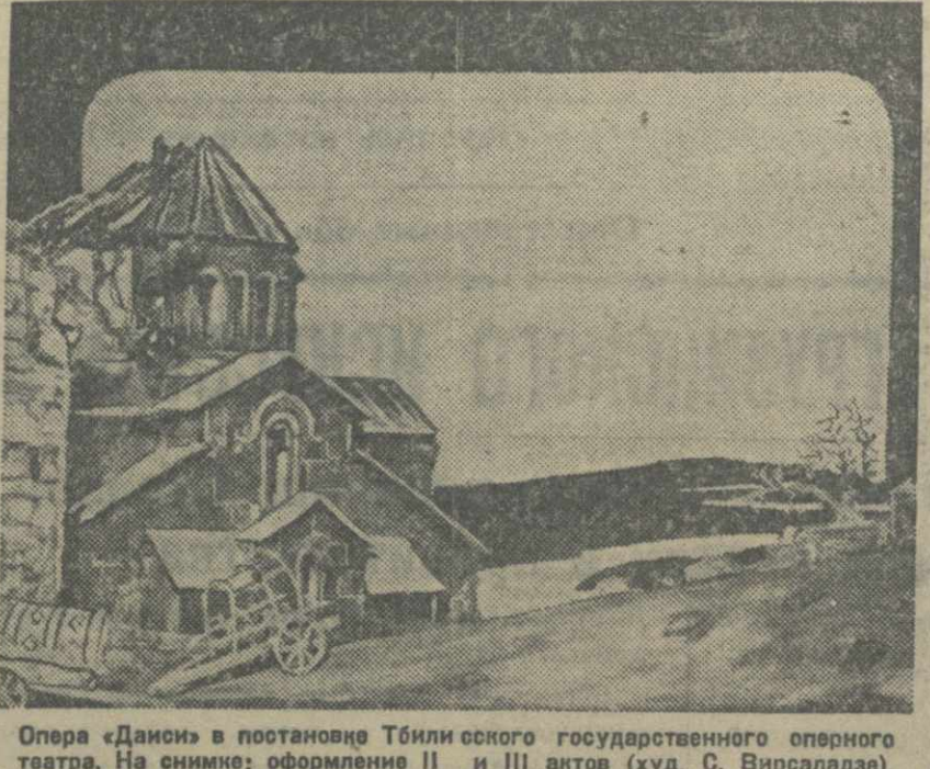
Опера «Даиси» в постановке Тбилисского государственного оперного театра. На снимке: оформление II и III актов (худ. С. Вирсаладзе).

«На последней полосе «Правды» печатается большой фотоснимок (во всю ширь полосы) сцены из третьего действия оперы «Дареджан и Шерван».