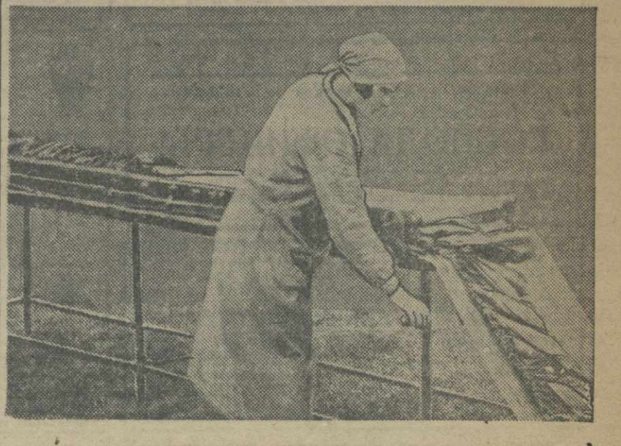
Табачно-низальная машина, изобретенная тов. Квирквелия.