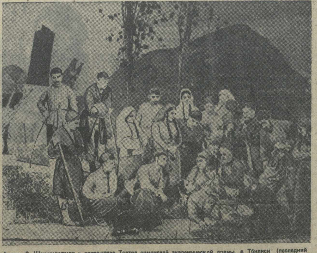
«Арсен» С. Шаншишвили в постановке Театра армянской академической драмы в Тбилиси (последний акт).