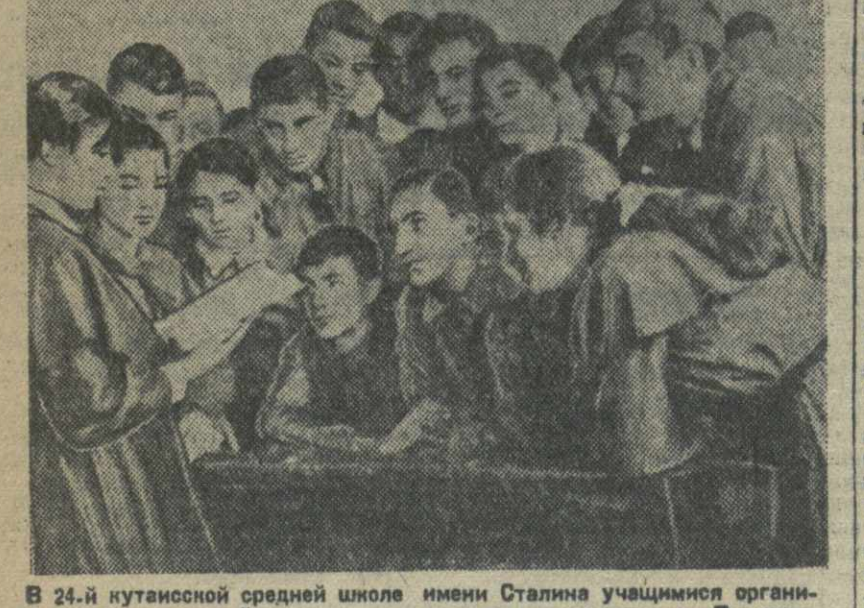
В 24-й кутанской средней школе имени Сталина учащимися организован литературный кружок по изучению творчества Пушкина. На снимке: коллективное чтение произведений Пушкина на очередном занятии кружка.

ЕРЕВАН, 8. (ТА). В 11 час. 40 минут ночи 7 января в Ереване повторилось землетрясение, превзойшее по силе и продолжительности предыдущие толчки. Сильно качало