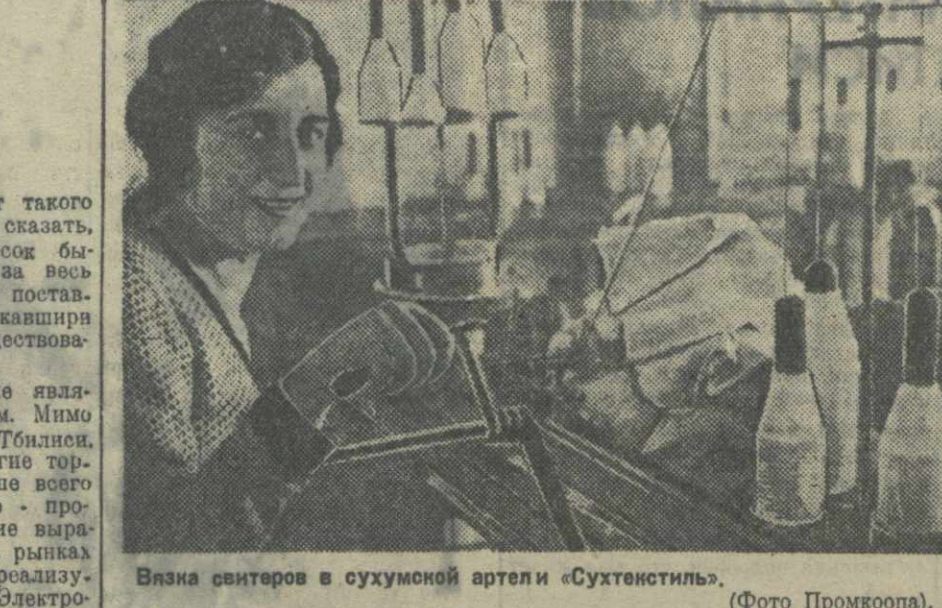
Власть ситеров в сукхумской артели «Сухтенстиль».