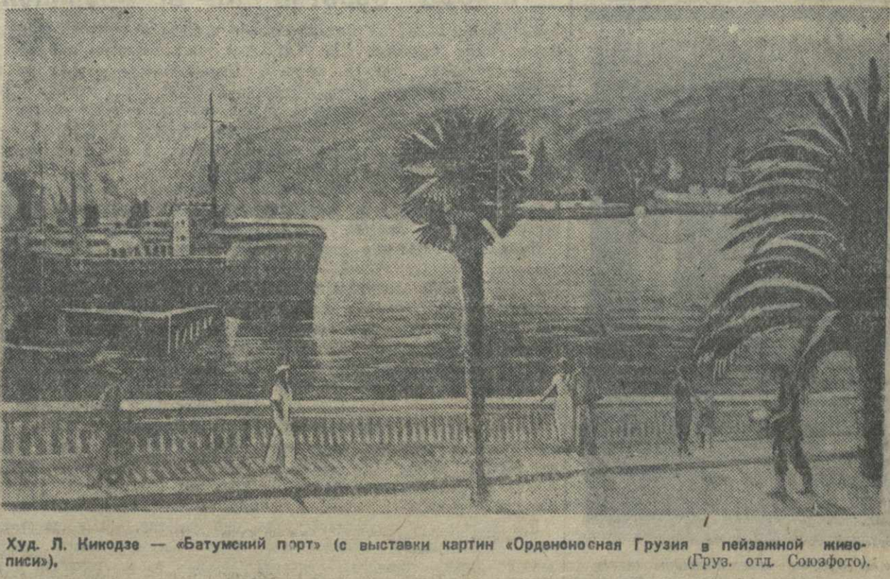
Худ. Л. Кинодзе — «Батумский порт» (с выставки картин «Орджоникидзе в Грузии» (Груз. отд. Союзфото).

15 января открылся новый кино-театр в Гори. Кино-театр в Гори.