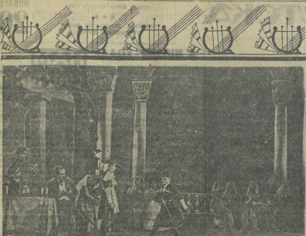
Декада грузинского искусства в Москве, 11 января в Государственном Академическом Большом театре СССР состоялся оперный спектакль Тбилисского государственного театра оперы и балета «Нето и Кота» (музыка В. Додиава). На сцене: сцена из 1-го действия.