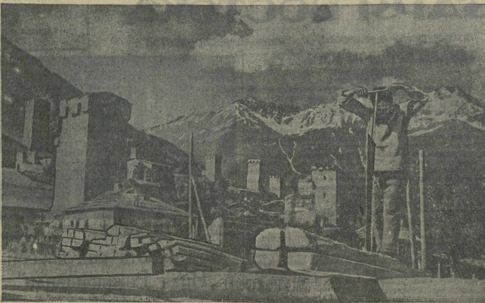
Святили разны меняет свое лицо. В окружении снеговых гор сваны еще негавно жили в темных, без око «корак» (домиках)...