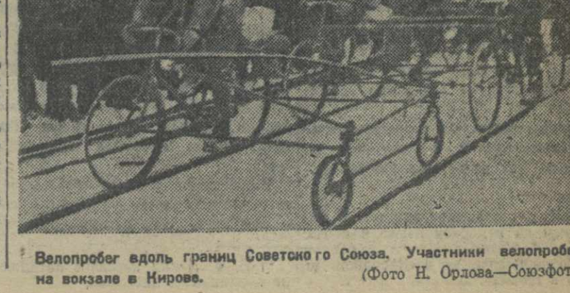
Велопробег вдоль границ Советского Союза. Участники велопробега на вокзале в Мирове.

МИНСК, 20. (ТА). Вчера вечером в Минск прибыл 5 отважных пограничников — динамовцев, совершивших бурю, участники велопробега стартовали на Киев.