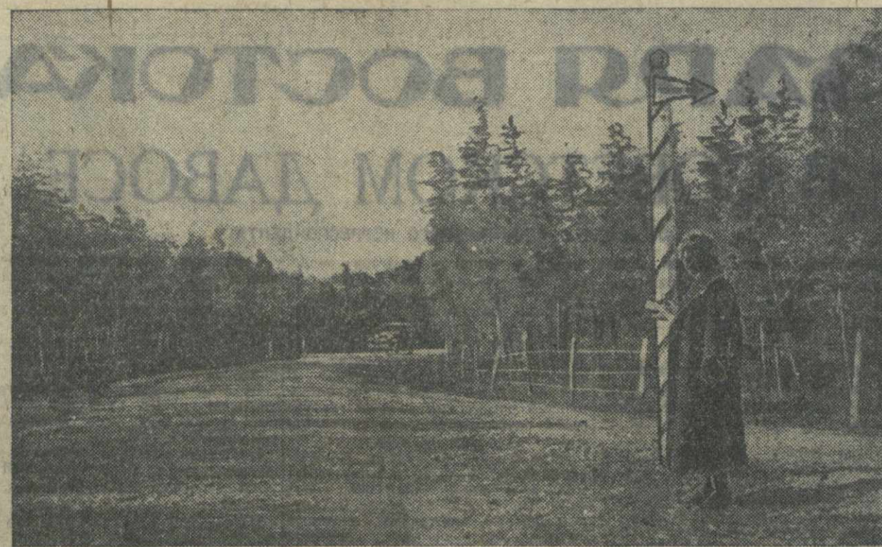
В Чаквинском совхозе имеются большие насаждения бамбука, дающего ценный материал для производства самых разнообразных изделий. На снимке: интритланционная дорога, проходящая между зарослями бамбука.