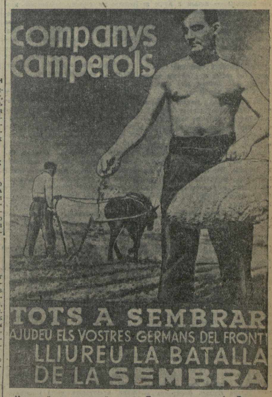
Испанский революционный плакат: «Товарищи крестьяне! Все на се! Помогите своим братьям на фронте! В борьбе за все будьте победителями!»

НЬЮ-ЙОРК, 5 (ГТА). Заключившая забастовка 40 тысяч моряков тихоокеанского побережья. Вступившие фактически добились удовлетворения всех своих требований. Все профсоюзы, за исключением профсоюза паролочных служащих и механиков, добились увеличения зарплат и права контролировать наем и увольнение рабочих.