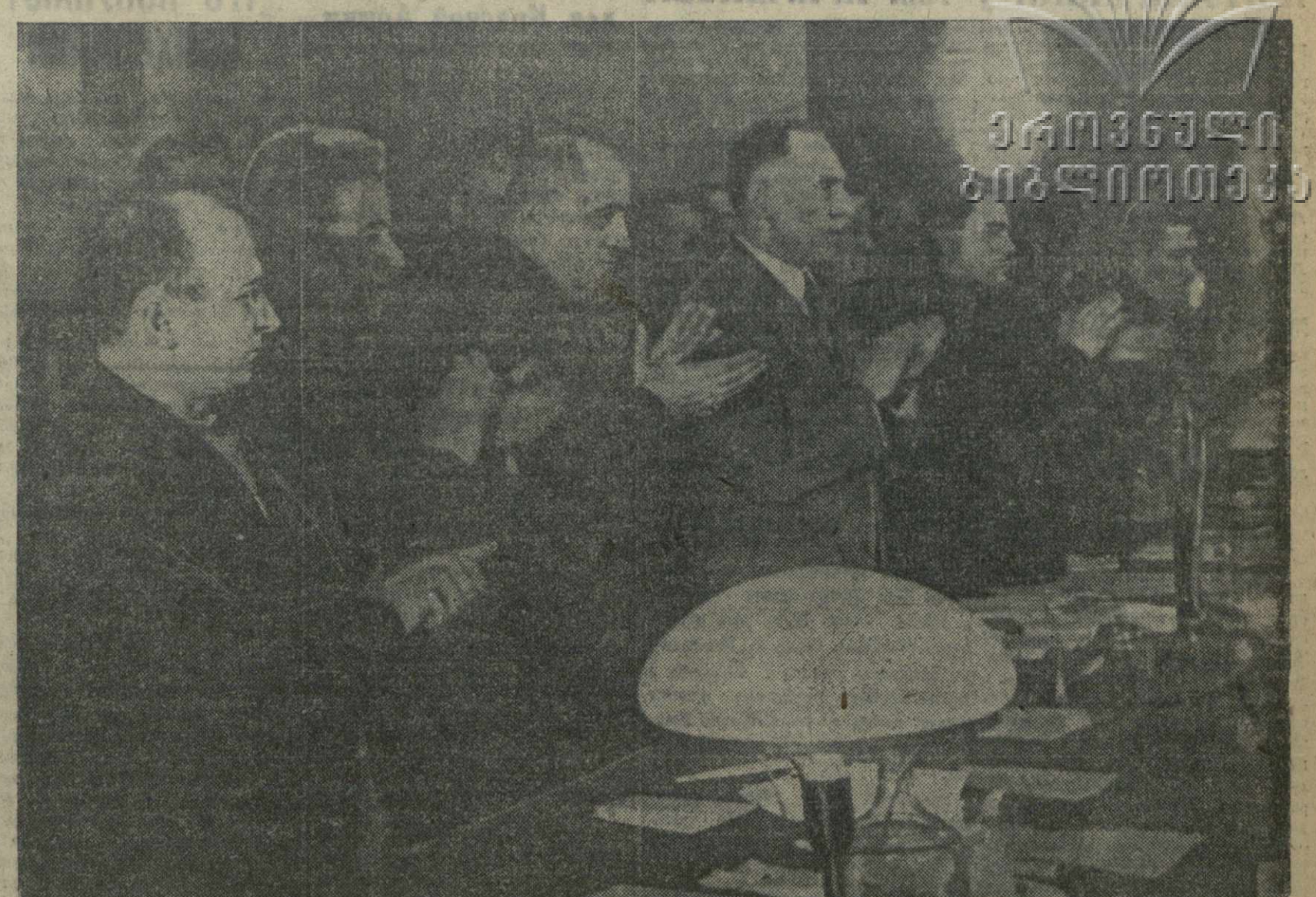
В президиуме чрезвычайного VIII Всегрузинского С'езда Советов: товарищи Л. П. БЕРИЯ, Г. СТУРУА, З. ЛОРДКИПАНИДZE, Г. МГАЛОБЛИШВИЛИ, М. НИОРАДZE, В. БАХРАДZE, Г. МУСАБЕНОВ.

МОСКВА, 9 (ГТА). 9 февраля с. г. министр иностранных дел Финляндии г-н Холсти был принят председателем Совета Народных Комиссаров Союза ССР тов. В. М. Молотовым.