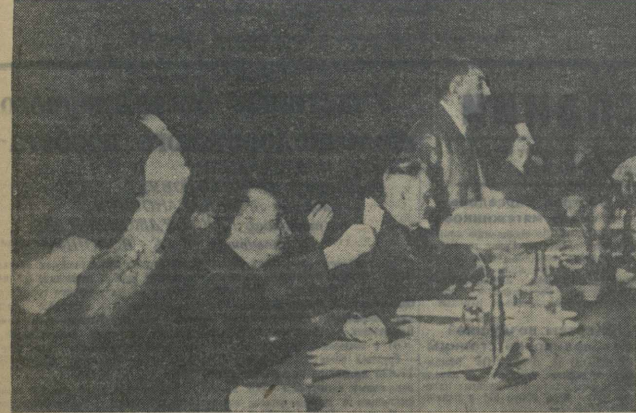
На Чрезвычайном VIII Всегрузинском Съезде Советов. Товарищи Л. Берия, Г. Мгалоблишвили, Г. Чкава в президиуме Съезда во время постановки резолюции о принятии Конституции Грузинской ССР.