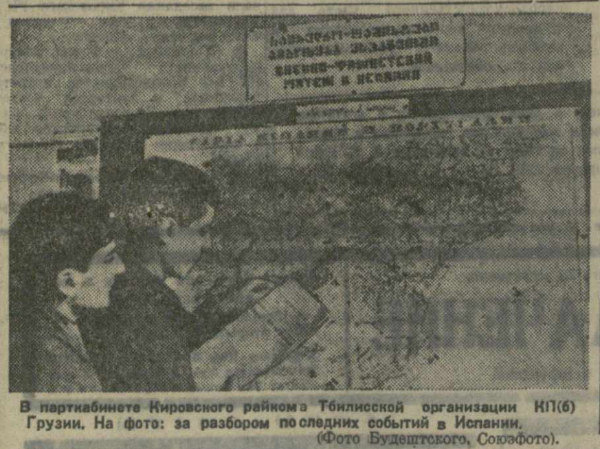
В партбюро Кировского района Тбилисской организации ВКП(б) Грузии. На фото: за разбором последних событий в Испании.

Всей в прениях выступило 34 коммуниста, подвергнувших критике работу райкома и первичных организаций и внесших отдельные предложения по улучшению постановки партийной работы.