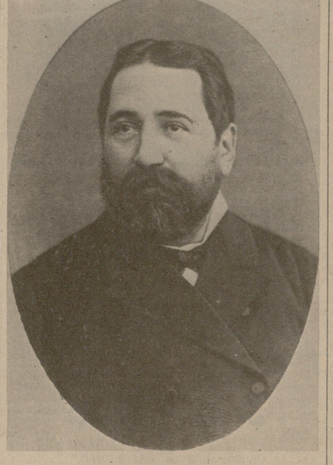
და თუნდ მთავრად, არ მთხინიან, მამარაჟი ის, რომ ჩემი ჰაბილი ნახუნ ბათ, ვინცა ჩემს უან ვლიან, თმაც: ალხარუა მან თმისი პალი,