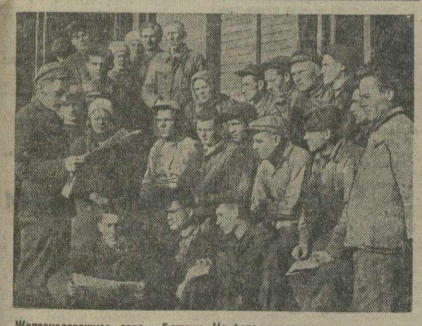
Нелегальное дело - Батуми. На фото: коллектив вагонного цеха депо, за чтитой новой Конституции Грузинской ССР.

«Неужели вы не видите, что г. Пешехонов отличается от г. Струве ничуть не больше, чем Бобчинский отличался от Добчинского?» («Сэарские меньшевики», 1906 г., том X, стр. 73).