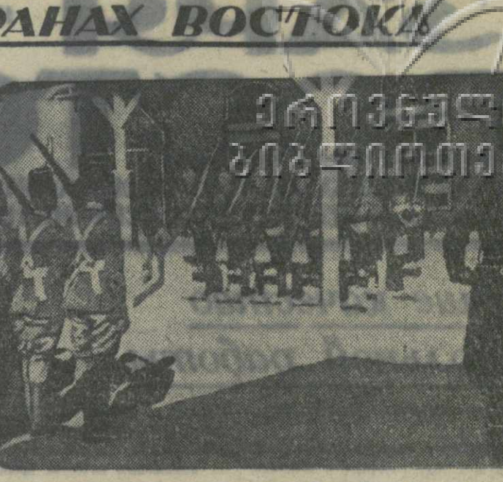
По условиям нового англо-египетского договора, Англия обязалась вывести свои войска из некоторых частей страны. На снимке: замена английского караула египетским в одной из казарм в Каире.