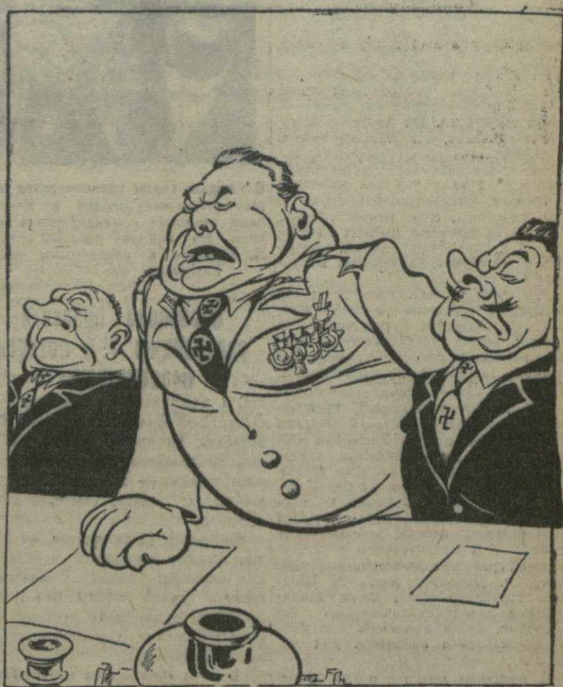
— В первую очередь предлагаю организовать департамент по лишению детей молока, институт питания взрослых воздухом и комитет по истреблению критиков...