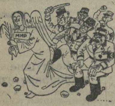
Вон эту личность из Германии, она порочит нашу честь! (Из пражской „Лейце фольксцейтунг“).